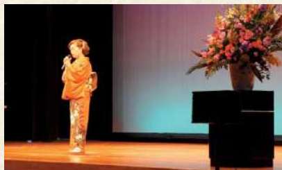
華やかな祝儀舞に始まり、笑いあり、感動いっぱいトークショー