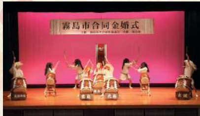
力強い九面太鼓の演奏で、お祝いに華を添えていただきました

結婚50年を迎えられたご夫婦をお招きし、長きにわたり社会にご貢献いただいたことに感謝するとともに、今後ますますのご健康と仲睦まじい生活を送られることを祈念し、例年、霧島市の共催を得て、霧島市社会福祉協議会が開催しています。