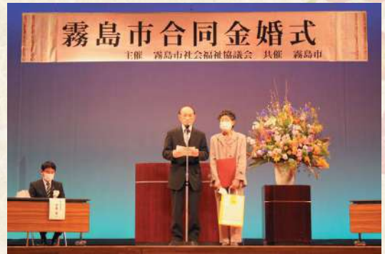
参加者を代表して、記念品贈呈後にごあいさつをいただきました

なお、本式につきましては、感染症予防対策を十分に講じての開催となりましたが、ご出席いただきました皆様はもとより、霧島市長・霧島市議会議長及び単人農村環境改善センターのスタッフをはじめとする、関係の多くの皆様のご理解・ご協力をいただき、盛会に終えることができましたことに、感謝申し上げます。