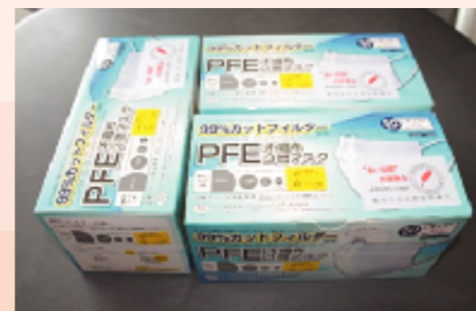
合計892名の方々に配布しました。

例年、地区内に子供などがいない、70歳以上の方を対象とした「ひとり暮らし高齢者の集い」を開催していますが、新型コロナウイルス感染症の影響を受け、実施することができませんでした。それに代えて、民生委員の皆様方のご協力により不織布マスクを配布し、見守り活動を行ないました。