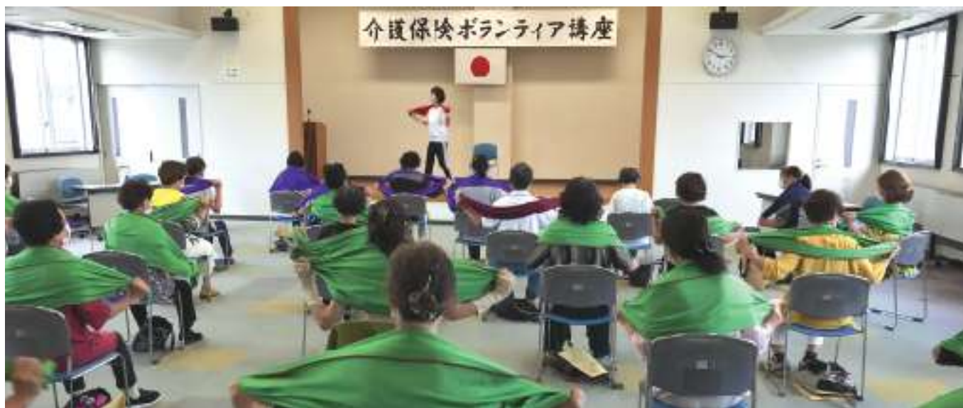
イスに腰かけていてもできる運動は安心