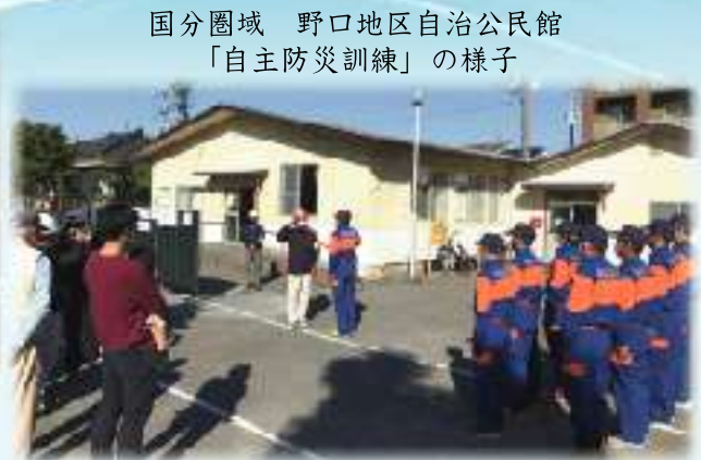
国分圏域 野口地区自治公民館 「自主防災訓練」の様子