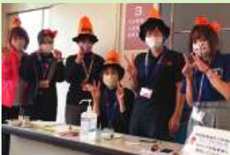
今年のハロウィンは、ボランティア講座の日でした。少しのユーモアで自分たちのココロも元気に♪