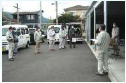
出発式～入念に打ち合せ～

訪問を受けた方々は、「自分ではなかなか点検できないところを専門の方々に診ていただき、安心しました。」と感謝されておりました。