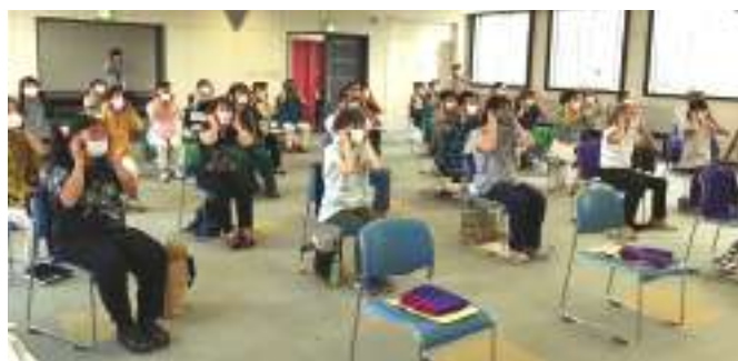
自宅でも続けられそうです