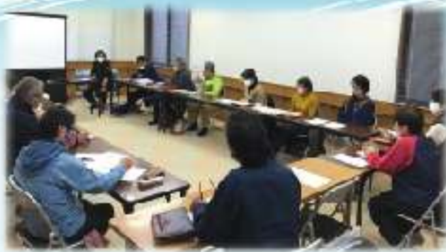
牧園圏域 高千穂7区自治会 「見守り隊の在り方検討会」の様子