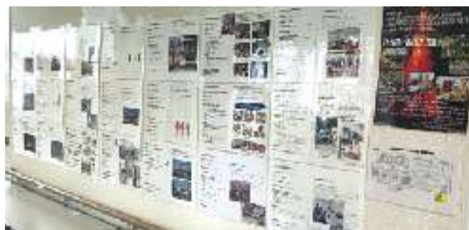
ボランティア団体の紹介コーナーも