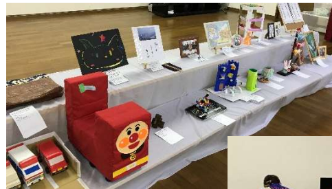
展示品の一つひとつ見させていただきました♪