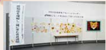
霧島市役所でのパネル展示 (昨年度の様子)

認知症は誰もがなりうるものであり、家族や親しい人が認知症になることなども含め、多くの人にとって身近なものとなっています。