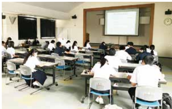
たくさんの感想が寄せられました

市内の高校に通う生徒を対象に、サマーボランティア体験の事前研修をおこないました。