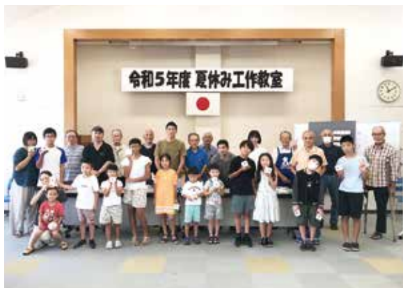
夏休み後半の楽しい思い出になりました

3年ぶりの開催となりました。おもちゃドクターに教えていただきながら、使用済みの牛乳パックを使った「パズルボックス」を作りました。「ルービックキューブ」のような仕組みになっていて、子どもも大人も夢中になりました。