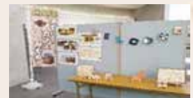
霧島市役所内で カフェを実施 しました