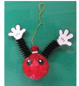
「バボちゃんヨーヨー」