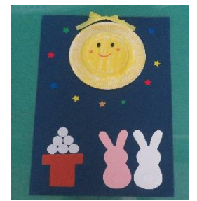
「十五夜タペストリー」