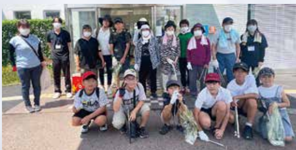
幅広い世代の交流の場ともなりました