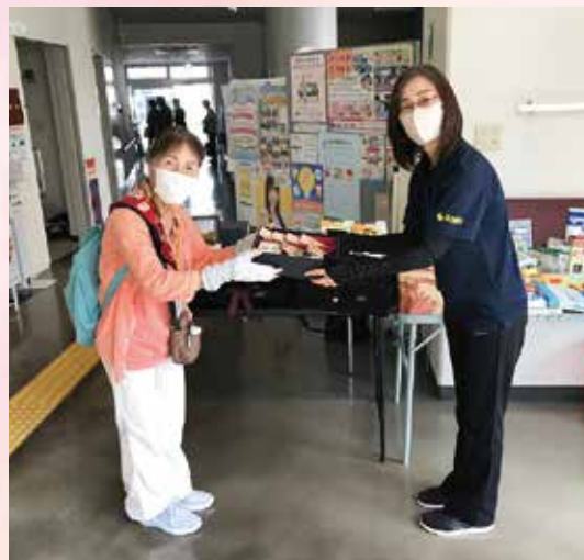
食品から日用品、不要になった制服等、さまざまな寄付物品が集まりました

フードドライブとは、家庭で余っている食品を回収拠点やイベントに持ち寄り、必要とされている方や団体等に寄付する活動です。この取り組みは、貧困問題の改善や食品ロスの削減、パートナーシップの活性化につながり、SDGs目標の達成につながると考えられています。