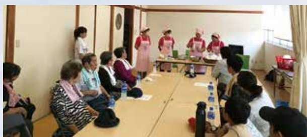
ピンクのシャツが目印の食生活改善推進員さん