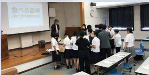
「食べる訓練」の様子

市内の高校に通う生徒を対象に、サマーボランティア体験の事前研修をおこないました。