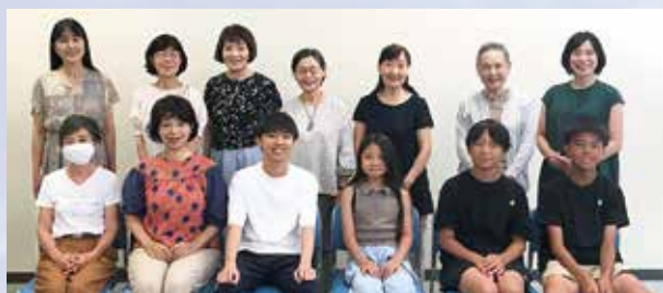
和やかな雰囲気の中、時間が過ぎていきました