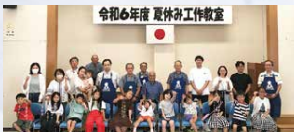
できあがったモビールは、世界にひとつだけの作品です