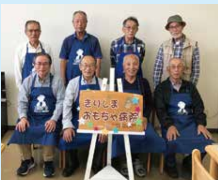
おもちゃドクターお仲間募集中です