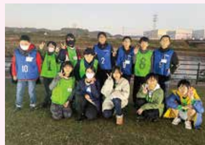
11月30日 隼人ランタンFesにて～天降川橋下の河川敷～