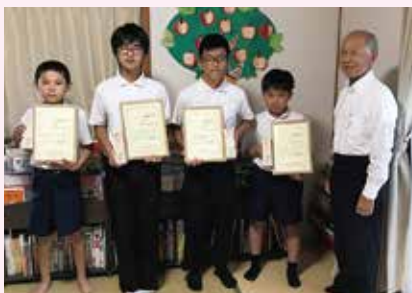
11月5日 事業所に出向いて～りんごの樹～

なお、活動認定証交付式は、社会福祉協議会本所・各支所でおこなうほか、学校や事業所、地域などに出向いてもおこなっておりますので、お気軽にご相談ください。