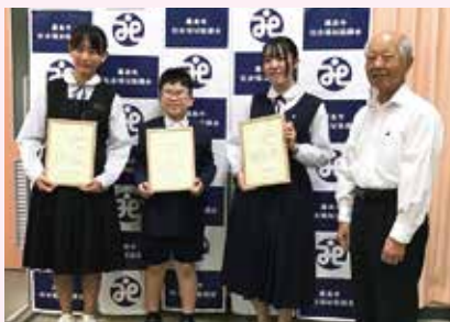
11月6日 放課後に来ていただいて～国分総合福祉センター～