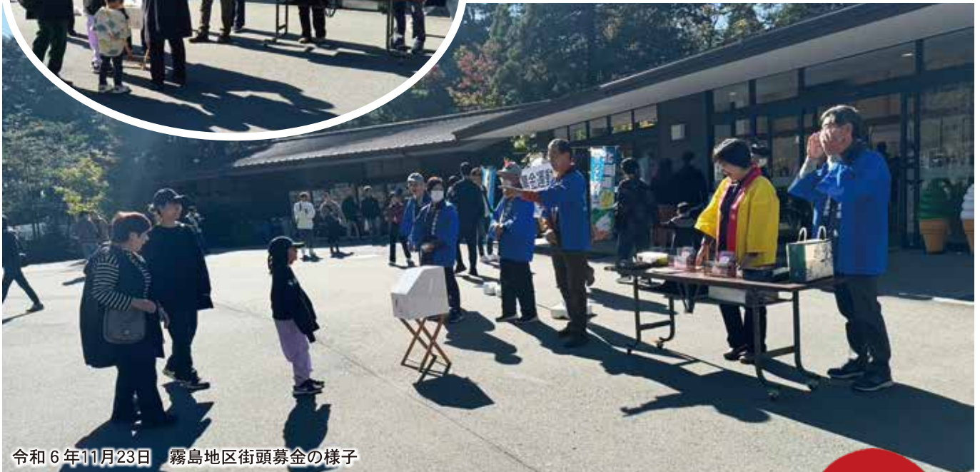
令和6年11月23日 霧島地区街頭募金の様子